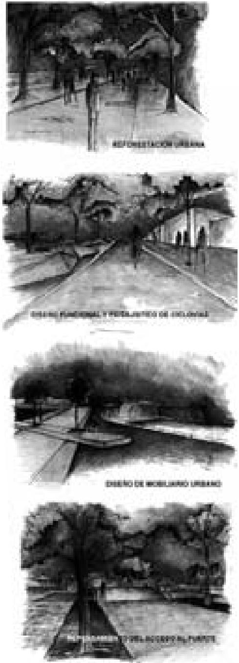
Figura 3. Representación conceptual de la solución del proyecto. Fuente: Elaboración propia.

territorio. Muchas de estas especies arbóreas presentes en nuestras calles han procedido de gran diversidad de especies de árboles y arbustos tradicionalmente cultivados en huertos o solares mayas (García de Miguel, 2000). El criterio más importante que se ha seguido para este proyecto paisajístico es aquel que reconoce en las especies, además de su importancia ecológica, sus funciones ornamentales, medicinales, frutales y aromáticas, profundamente ligadas con la historia cultural del pueblo, y por ende, componente fundamental del patrimonio. Con base en estudios del Centro de Investigación Científica de Yucatán, entre otros (Chab, 2010; Orellana, 2007), se presenta la siguiente paleta vegetal descrita en la tabla 1, con el objetivo de sugerir especies complementarias a las existentes y dotar al espacio público de especies nativas con amplio significado cultural y valor ambiental. No se incluyen especies cubresuelos de uso común (ver Tabla 1).