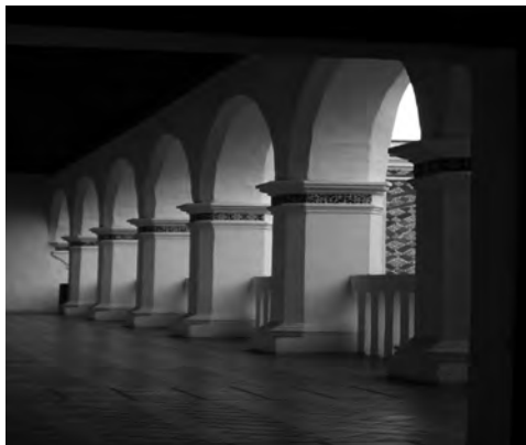
Imagen 1. Claustro del Ex-convento de Santa Mónica, Puebla, Puebla.

cerrados asociados con las mujeres, entre otros fundamentos teóricos o de ciertos componentes del feminismo y bajo consideraciones muy específicas de la violencia simbólica y otros aspectos de este tipo de desigualdad social.