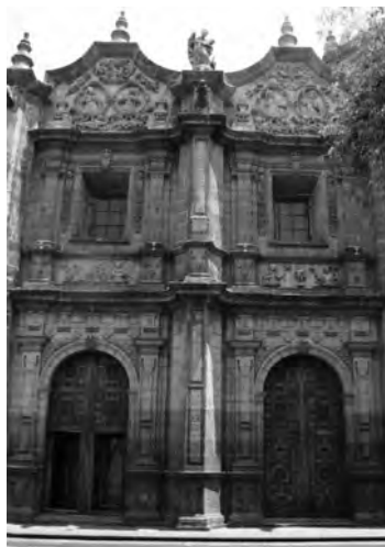
Imagen 5. Puertas "gemelas" del Ex-convento de Santa Rosa María, Morelia, Mich.

Siempre que se habla de varias de estas ciudades, es inevitable relacionarlas con sus fundaciones monásticas -tanto de frailes como de monjas-, algunas han logrado conservar estos inmuebles de tal manera que ahora son consideradas como ciudades coloniales y patrimonio de la humanidad por la categorización que hizo la UNESCO, como es el caso de Querétaro, urbe con investigaciones notables sobre la importante contribución de los conventos novohispanos a su traza y paisaje actual. Esta ciudad también es de los pocos casos de los que se ha documentado la evolución urbanística de las metrópolis novohispanas, que recibió parte de su traza y actual paisaje debidos a la presencia de sus conventos femeninos.