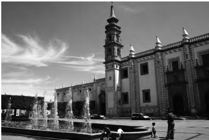
Imagen 6. Ex-convento de Santa Rosa de Viterbo, Querétaro, Qro.

solares, terrenos 8 , así como mercedes de agua, activando con estos movimientos la morfología y diseño urbano tanto fuera como dentro de los conventos.