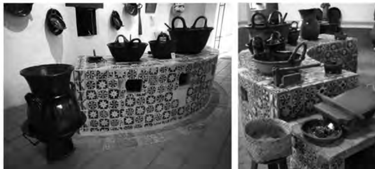
Imagen 2. Cocina del Ex-convento de Santa Mónica, Puebla, Puebla.

Entre ellas, se puedan citar las simbolizaciones de los roles sociales y aquellas formas de pensamiento religioso y de espiritualidad que, entre otras predeterminaciones y expresiones de la religiosidad imperante, ponderaban el encierro, el castigo corporal y la penitencia, así como el pensamiento de la época y los innumerables sacrificios de las monjas al “renunciar al mundo”. Entre ellos se cuentan las penitencias y algunos otros roles de las religiosas de esos tiempos y diversos elementos como su arquitectura particular y el impacto en el urbanismo local, la negación del mundo terrenal para las “esposas y siervas de Dios”, todos ellos tienen puntualmente respuestas para cada espacio y diferentes obras de arte dentro de los conventos femeninos.