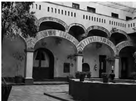
Imagen 3. Ex-convento de la Purísima Concepción, Puebla, Puebla.

Por su parte, la socióloga Marcela Lagarde (2003) sostiene que el atávico encierro de la mujeres va relacionado directamente con el ejercicio del poder del varón o androcentrismo de la estructura social, el que, bajo esquemas de dominación tradicionales, ha confinado a la mujer a dichos espacios. No se debe olvidar las herencias de las grandes haciendas y mayorazgos que fueron reservadas para primogénitos o hijos varones. Así, en el enclaustramiento la mujer desarrolla labores de curación, de cocina, educación, entre otros, que distan mucho de otras actividades como las académicas, políticas e intelectuales vinculadas al espacio externo o público de los varones.