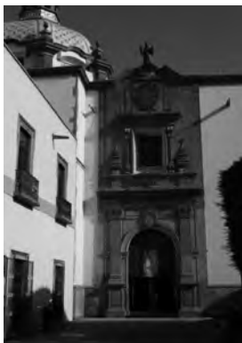
Imagen 4. Una de las puertas "gemelas" del Ex-convento de Santa Clara, Querétaro, Qro.

visuales y espacios con funciones muy específicas. Así, San Jerónimo, a quien se le atribuye la imposición de ciertas condiciones para originar el encierro, indica que las mujeres deberían llevar una vida completamente ascética. Proponía que los padres ofrecieran a sus hijas vírgenes y a concentrarlas en el monasterio donde no viesen otra cosa que las desviara de la virtud.